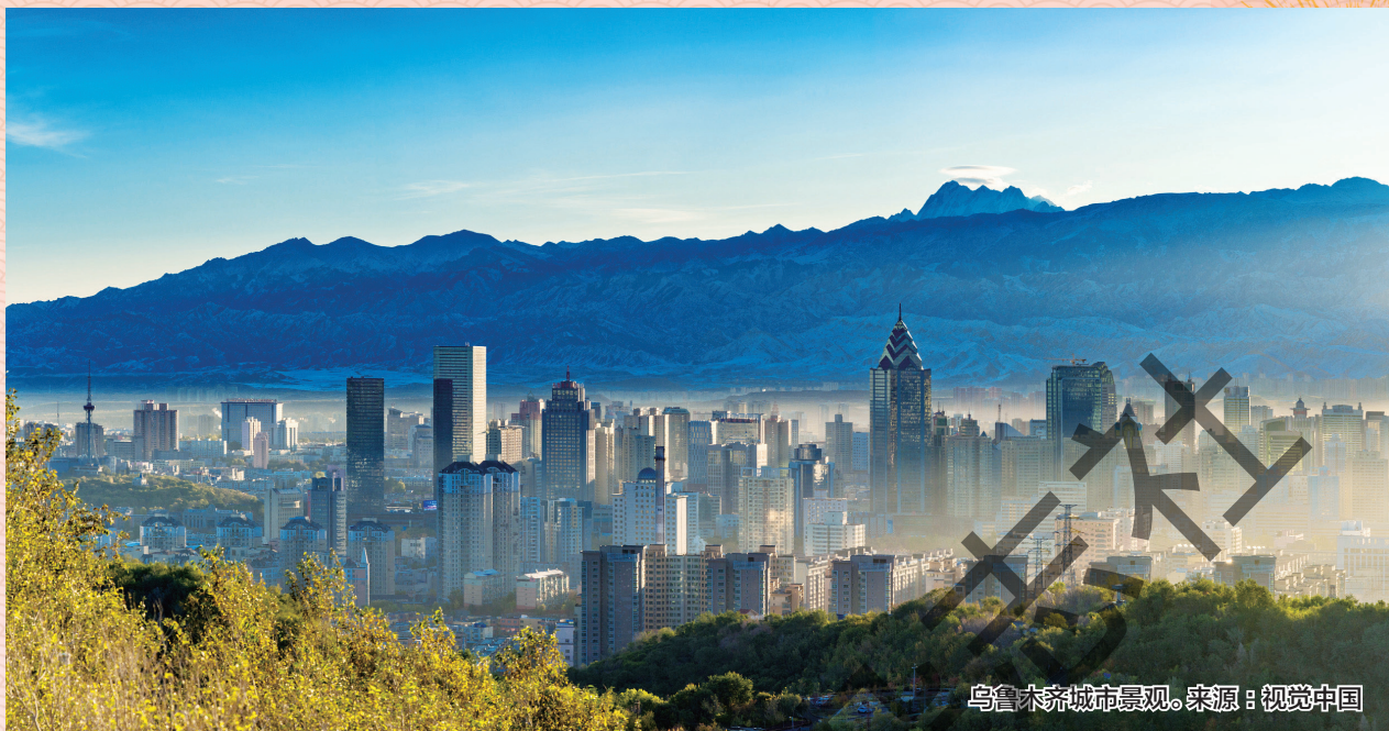
乌鲁木齐城市景观。

房保障与老旧小区改造补助资金，支持加快推进保障性住房建设及城中村改造，持续推进老旧小区改造，增加保障性租赁住房供给，更好满足刚性和改善性住房需求，进一步完善住房保障体系。