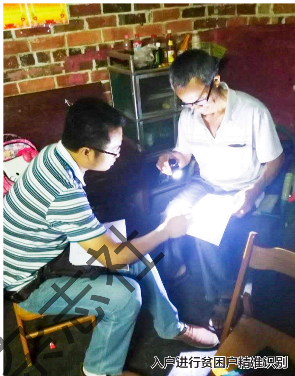
入户进行贫困户精准识别

两年半来，朱飞先后争取到20多个项目，总资金1800多万元，为双达村基础设施建设和扶贫项目的实施奠定了基础。为确保工程质量，并如期