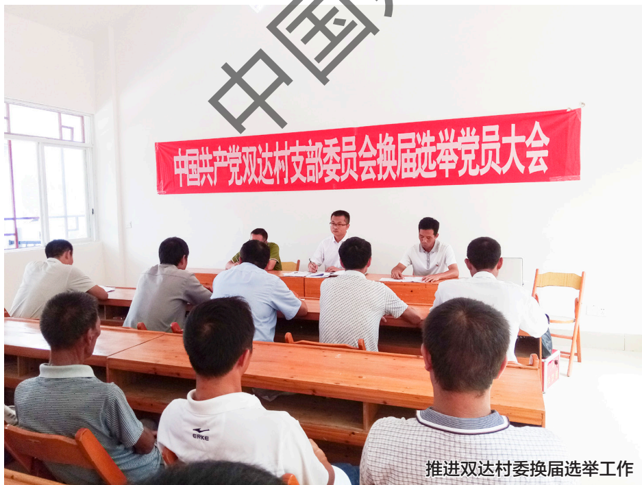
推进双达村委换届选举工作