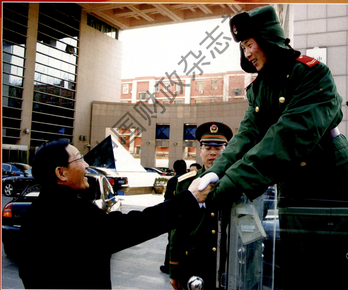
新年的第一声问候