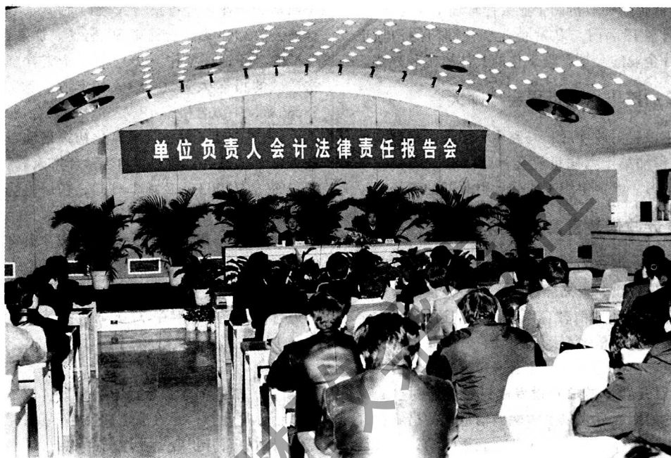
合肥市人民政府举办单位负责人会计法律责任报告会