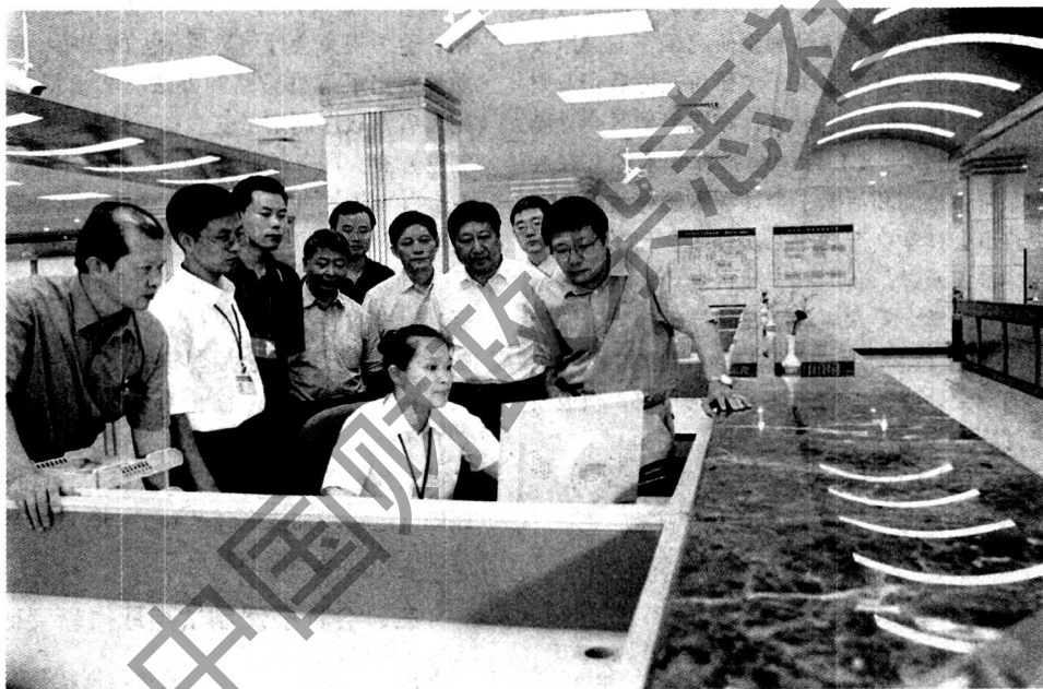
财政部常务副部长楼继伟参观安徽财政厅国库支付中心大厅

高级会计师任职资格评审中,申报人员只有专业知识测试和论文答辩都合格才能进行评审。经过严格的初审、测试、答辩、评审,全省共有57人取得了高级会计师任职资格。④会计人员继续教育管理。省财政厅制定了《关于做好2002年度会计人员继续教育培训工作的通知》,要求全省会计人员继续教育培训在实行统一领导、分级管理的原则下,重点抓好会计人员职业道德和业务知识两方面培训。全省共培训会计人员14.6万人次。⑤积极开展会计诚信建设。全省各地以提高会计人员职业道德为中心,积极开展会计诚信建设,努力为会计工作营造良好的社会环境。省财政厅组织开展了会计人员职业道德万人问卷调查活动,合肥市举办了会计职业道德建设演讲比赛和有奖征文活动,蚌埠市着手研究建立企业财务会计信用等级评价制度,马鞍山市开展了会计人员表彰奖励等活动。