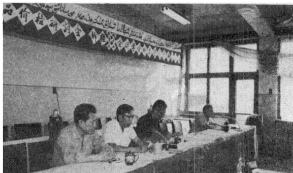
(图为会计学会成立大会主席台)