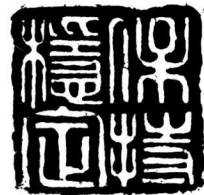
保持稳定 王尚明 刻

1994年3月31日《经济日报》发表该报记者李争平的报道《坚决打击发票犯罪活动》。报道说:近一时期一些地方极为猖獗的伪造、倒卖、盗窃发票的违法犯罪活动及一些不法分子利用假增值税专用发票,直接偷税、骗取出口退税,干扰税制改革正常进行的严重情况,已引起中央领导同志的高度重视。中共中央政治局常委、国务院副总理朱镕基和国务委员、国务院秘书长罗干3月30日下午在最高人民法院、最高人民检察院、公安部、国家税务总局召开的部署近期在全国打击伪造、倒卖、盗窃发票违法犯罪活动的电话会议上表示,对此类犯罪要坚决打击,决不手软。罗干在强调严厉打击此类犯罪重要性时指出,作为今年几大改革举措之一的税制改革,其核心内容就是要建立以增值税