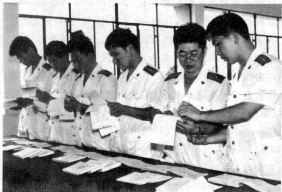
图二、账簿、凭证评比。