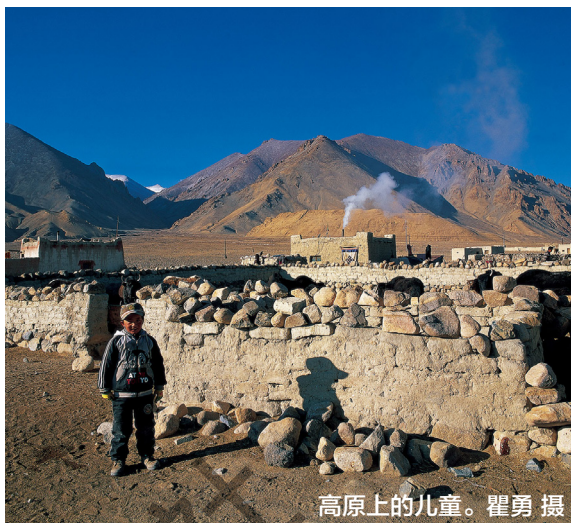
高原上的儿童。

后，克松村相继建立了西藏第一个农民协会、第一个人民公社、第一个完全小学。可以说，这里是西藏社会变革、农奴翻身作主的见证地。