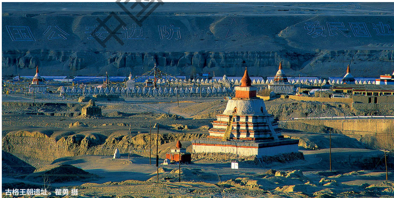
古格王朝遗址。