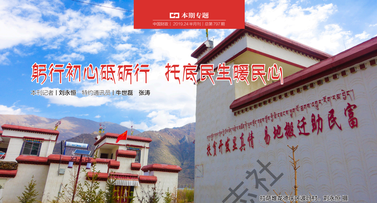
拉萨堆龙德庆区波玛村。

民生连着民心，改善民生是西藏工作的重中之重，也是实现长治久安的基础。西藏民主改革 60 年来，在经济发展的基础上，西藏财政不断加大支出力度，采取有力措施，全力支持打赢脱贫攻坚战，着力保障和改善民生，时时处处为西藏各族群众办实事，提高群众获得感和幸福感，让“民生阳光”普照雪域高原。