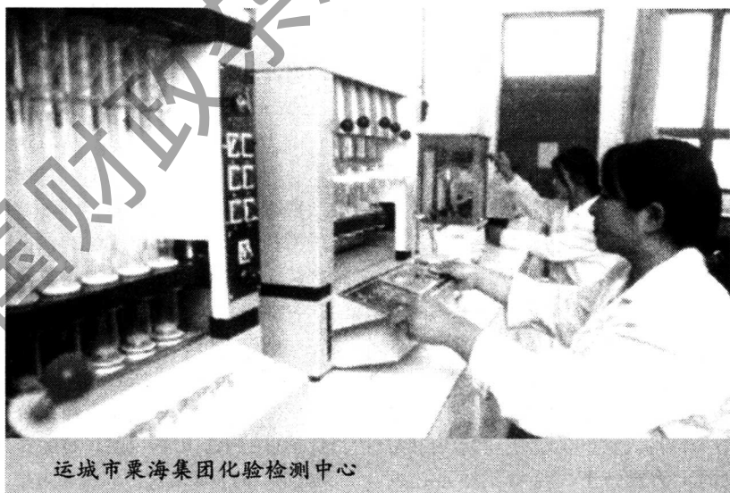
运城市粟海集团化验检测中心

色产业种植面积逐年扩大，已初显规模化发展态势，如全市植棉万亩以上的乡镇就有17个。一些传统的特色产业得到进一步加强，像永济的芦笋，万荣的大葱，平陆的百合，新绛的无公害蔬菜等在全省优质水果蔬菜展销会上获得金奖。稷山县启动实施“两红战略”，把发展红枣和红提葡萄列为该县特色产业的重点，并取得突破性进展。此外运城市还以特色生态农业提升原有的基础产业，强化结构调整。如新绛县地处汾河岸边，种菜历史久远，现有的50万亩耕地中有20万亩种蔬菜，其中日光温室10万亩。为提升蔬菜效益，兼收养猪等综合效益，进行以沼气为龙头的“四位一体”（蔬菜温室、养猪、厕所和沼气池）大棚生产技术模式示范，并准备开始联片推广。2003年计划建设1000个大棚，