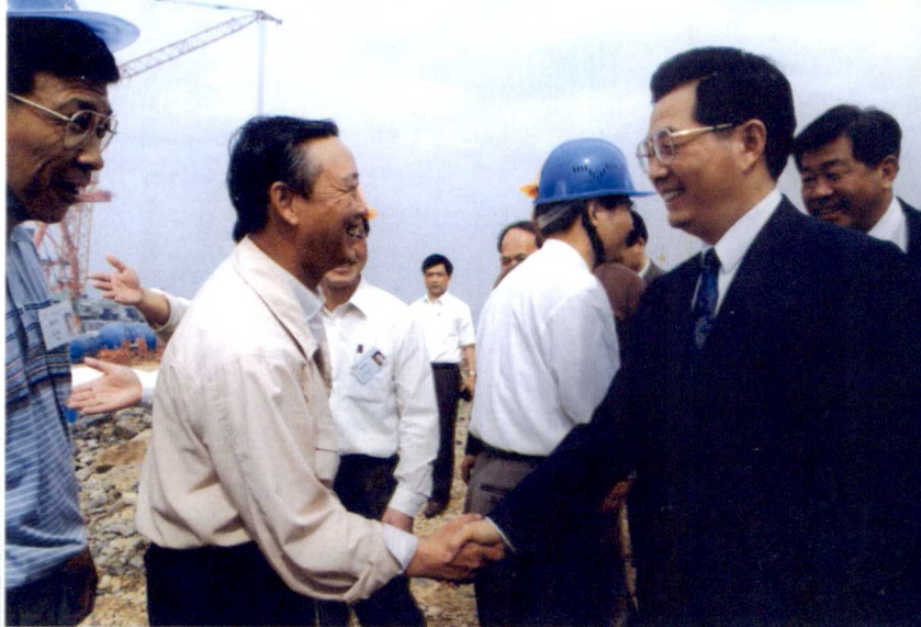
胡锦涛同志在海沧视察

翔鹭石化、柯达感光、夏新电子、厦门船舶重工、金龙客车、唐龙游艇等一批投资密度大、科技含量高、生产水平先进的重点项目，形成化工、电子、机械三大支柱产业。设有福建省惟一的出口加工区，成为厦门重要的经济增长点和主要工业基地。2004年度，海沧实现地区工业产值382.48亿元，GDP133.47亿元，税收34.2亿元，其中：区级税收4.29亿元，实际财力6.22亿元。为中央和厦门市财政收入作出了较大的贡献。