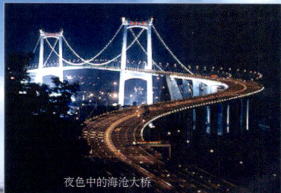
夜色中的海沧大桥