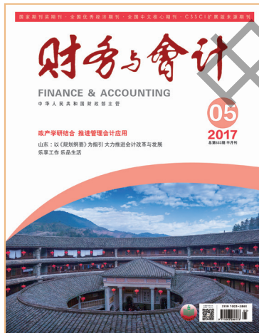
封面图片:福建永定土楼

天地不生屋宇,人以土木筑成,天地也不生文字,人就以智慧造成,惊喜于初始的安居温饱之后,便是漫长到无以复加的寻常生活。