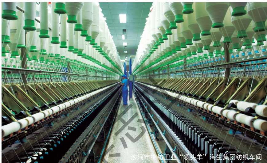
沙河市棉纺工业“领头羊”海生集团纺织车间

“走出去”——为切实了解国际金融危机给企业经营造成的影响，市财政局分组分批深入企业实地调研，主动为企业出主意、想办法。龙星化工股份