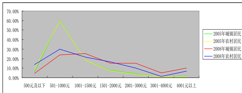
图 2 2005、2008 年宁波城乡居民收入情况

平均水平线以下，收入“被平均”现象比较明显。可见，收入分配不断向高收入户倾斜。另外，从不同收入群体收入增长速度来看，高收入户的增收能力明显高于低收入户，收入分配的“马太效应”较为明显。（如表 2）