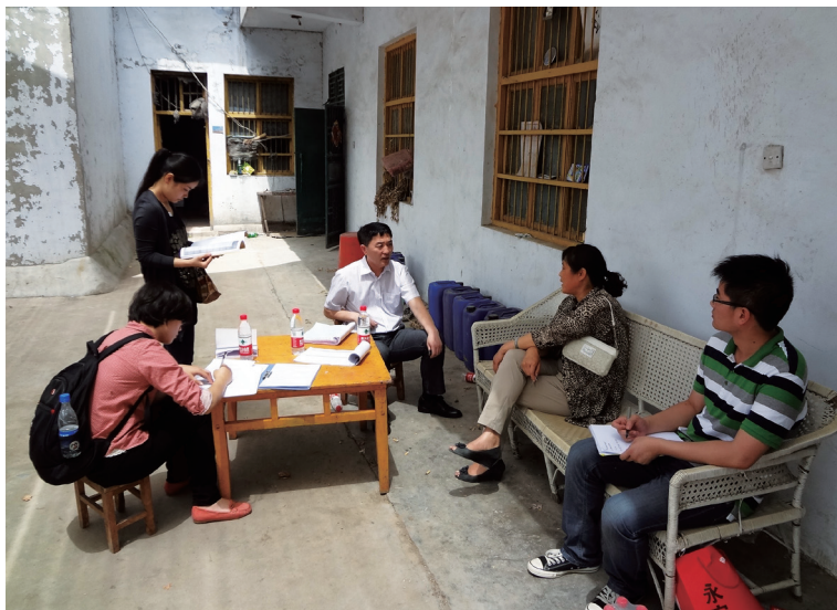
2014年4月—6月，河南专员办与保监会组成检查小组深入农户家庭，了解农业保险政策执行情况