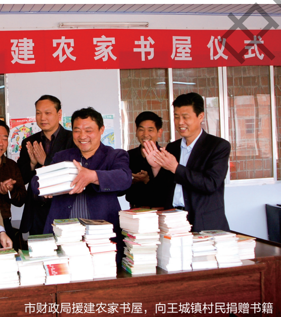
市财政局援建农家书屋,向王城镇村民捐赠书籍

一分耕耘,一分收获。几年来,枣阳市财政局深耕财苑,收获了诸多荣誉:连续8届保持湖北省级文明单位称号;连续11年在省财政厅工作目标考核中荣获A等次;连续8年在枣阳市实绩考核中稳居前列;2011年被湖北省人社厅、省财政厅联合授予全省财政系统先进集体;2012年被枣阳市委推荐为全省制度创新成绩突出单位。