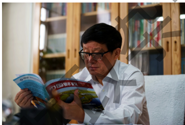
弯海川副主席表示，《中国财政》是他的必读刊物，经常能够给他带来启发

杂志社转变工作作风，深入基层宣传报道基层财政工作和基层财政人的做法很好。《中国财政》是我的必读刊物，经常能够带来启发，每次看到有共鸣、有借鉴意义的文章、段落，都会手抄到笔记本上，每年都会摘抄7、8本之多。“卷首”栏目很有特色，能够清晰传达改革的理念、思路，每期必看，建议继续增强内容的权威性，增强政策导向作用；“厅长论坛”栏目要选取有理论高度、有升华、有深度的文章，要为国家治理服务；“地方实践”栏目的一些文章很有借鉴意义，时常会选取其中的文章供相关处室参考，建议进一步提高稿件录用标准，一定要选取已经取得很好成效、有广泛借鉴意义且能够成为经典的经验做法。