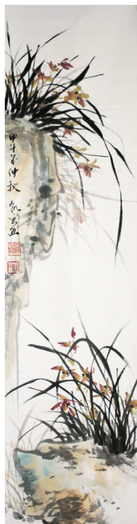
山西省阳泉市财政局 宋凯宏 国画作品