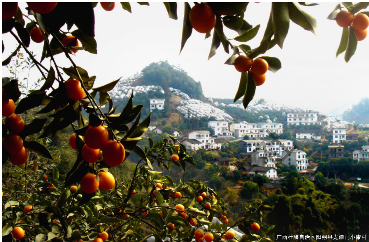
广西壮族自治区阳朔县龙潭门小康村