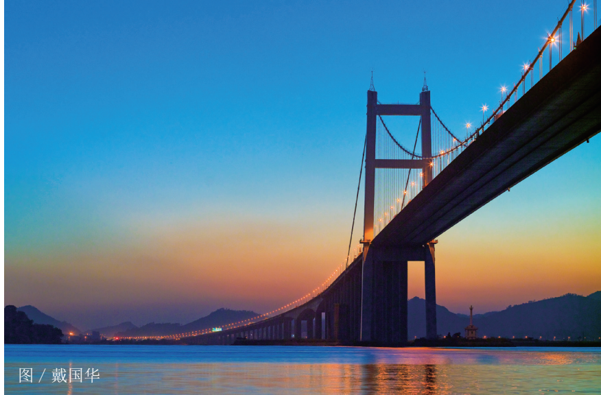
图 / 戴国华

环境管理控制评价报告为环境管理控制评价活动提供有效的决策信息,为实现环境管理控制系统目标提供可靠的支撑。环境管理控制评价报告应根据管理控制标准选择与管理控制执行活动,通过经营业绩评价活动,形成衡量各经营中心价值创造能力、风险管理控制与可持续发展能力的经营业绩评价报告,进行分析差异,确定影响因素,具体包括以下方面:(1)核心指标的执行情况:主要包括各部门的核心指标执行情况与评价标准之间差异分析的相关信息;(2)落实可持续发展战略指标的执行情况:主要包括各部门落实可持续发展战略指标执行情况与评价标准之间差异分析的相关信息;(3)相关差异的原因:主要反映企业各部门产生上述环境管理控制指标执行差异的原因。